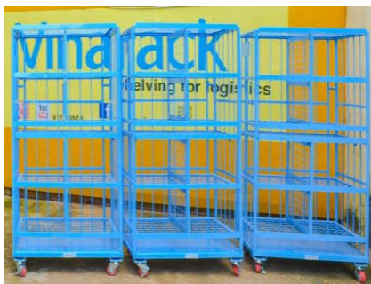
Xe Đẩy Hàng