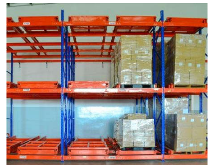
Kệ Push Back