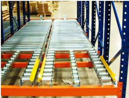
Kệ Pallet Flow Rack