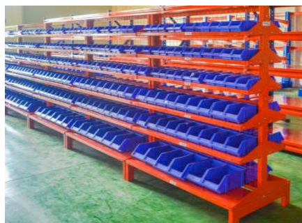
Kệ Phụ Tùng