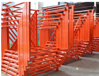
Pallet Xếp Chồng