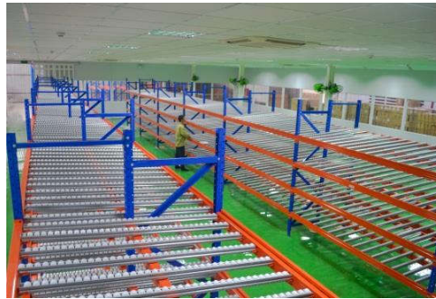
Kệ Carton Flow Rack